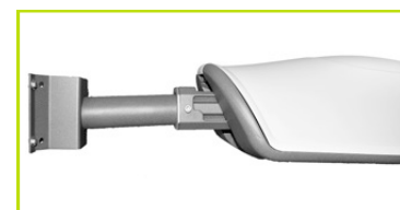
AVANTGARDE XL POSIZIONE ORIZZONTALE