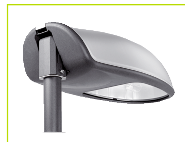
AVANTGARDE XL RETRO